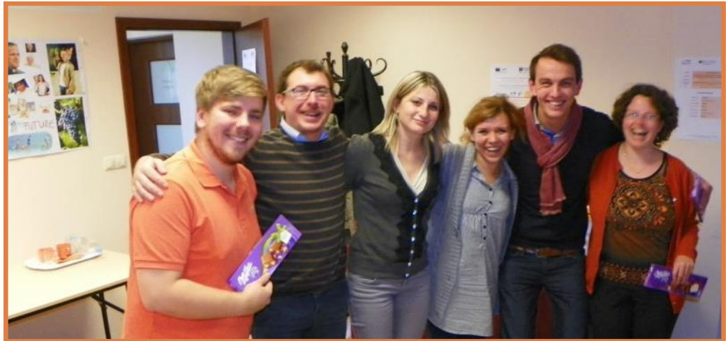
Vorstandsmitglieder Board members

Im Oktober 2013 fand in Krakau mal wieder die Mitgliederversammlung der Kolpingjugend Europa statt.